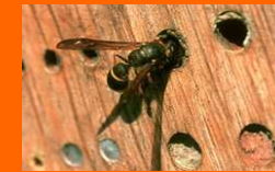
Sommige urtjeswespen stelen modder voor hun eigen nestjes

Modderdeksel (ruw oppervlak) met een groot gat erin. Nest van Metselbij ( Osmia rufa ) dat door onbekende parasieten of rovers is opgebroken